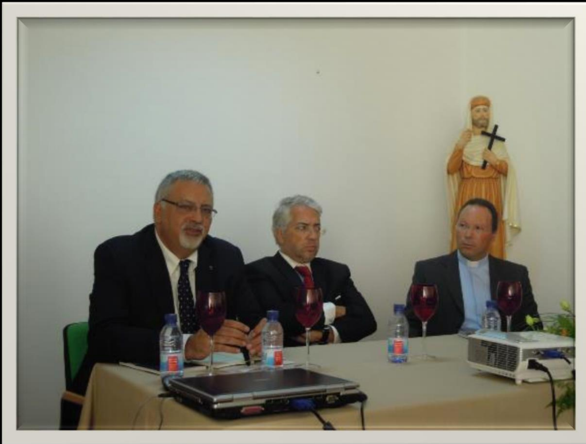
Colóquio APOM, Museu de Arte Sacra e Etnologia , Fátima 2011