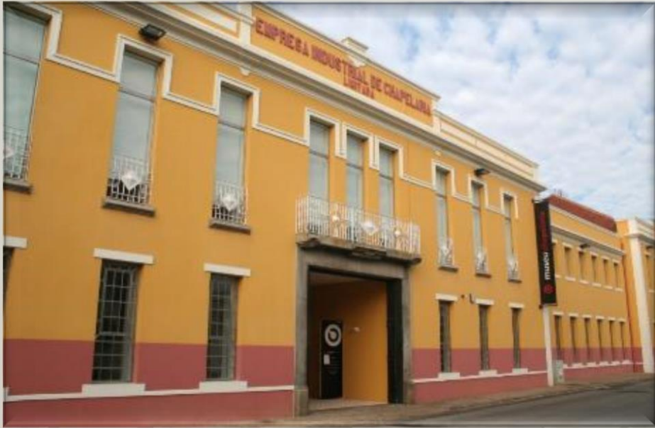
Museu da Chapelaria, 2009