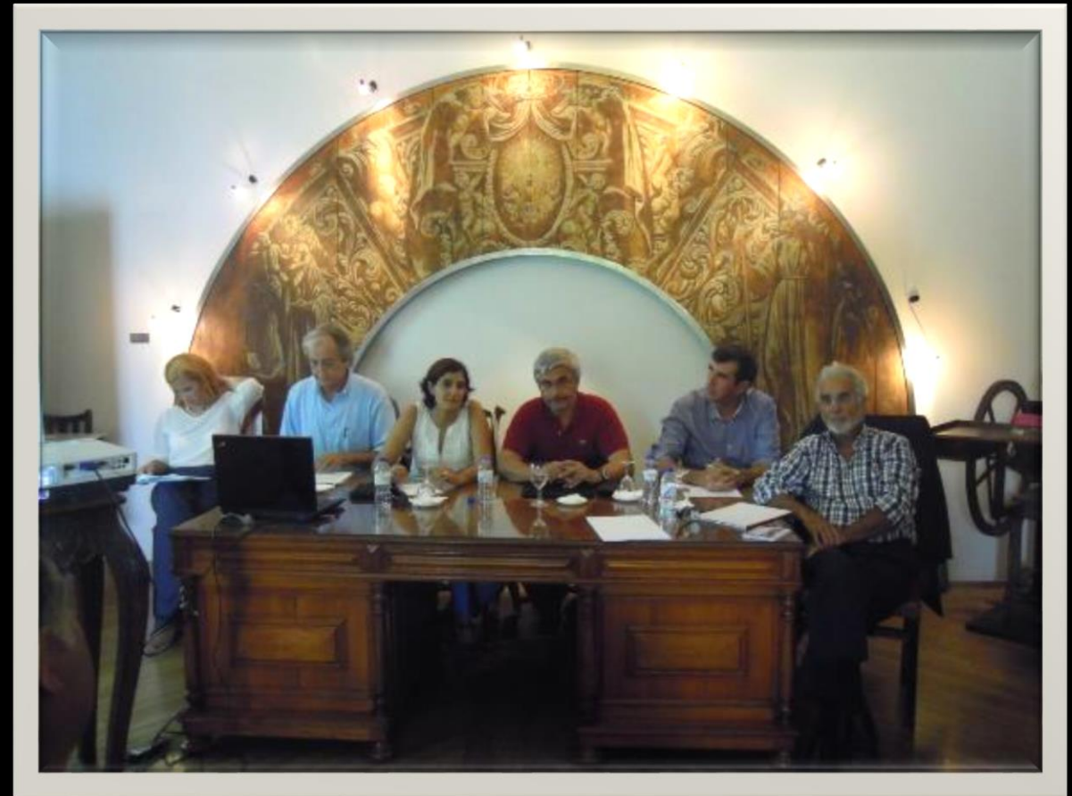
Mesa Redonda, Museu Municipal de Loulé 2013