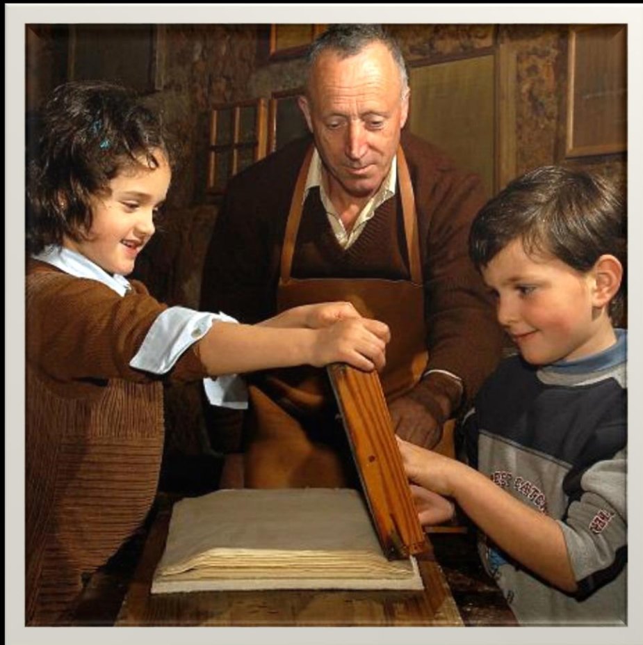
Museu do Papel

Um museu é uma instituição permanente, sem fins lucrativos, ao serviço da sociedade e do seu desenvolvimento, aberto ao público, e que adquire, conserva, estuda, comunica e expõe testemunhos materiais do homem e do seu meio ambiente, tendo em vista o estudo, a educação e a fruição.