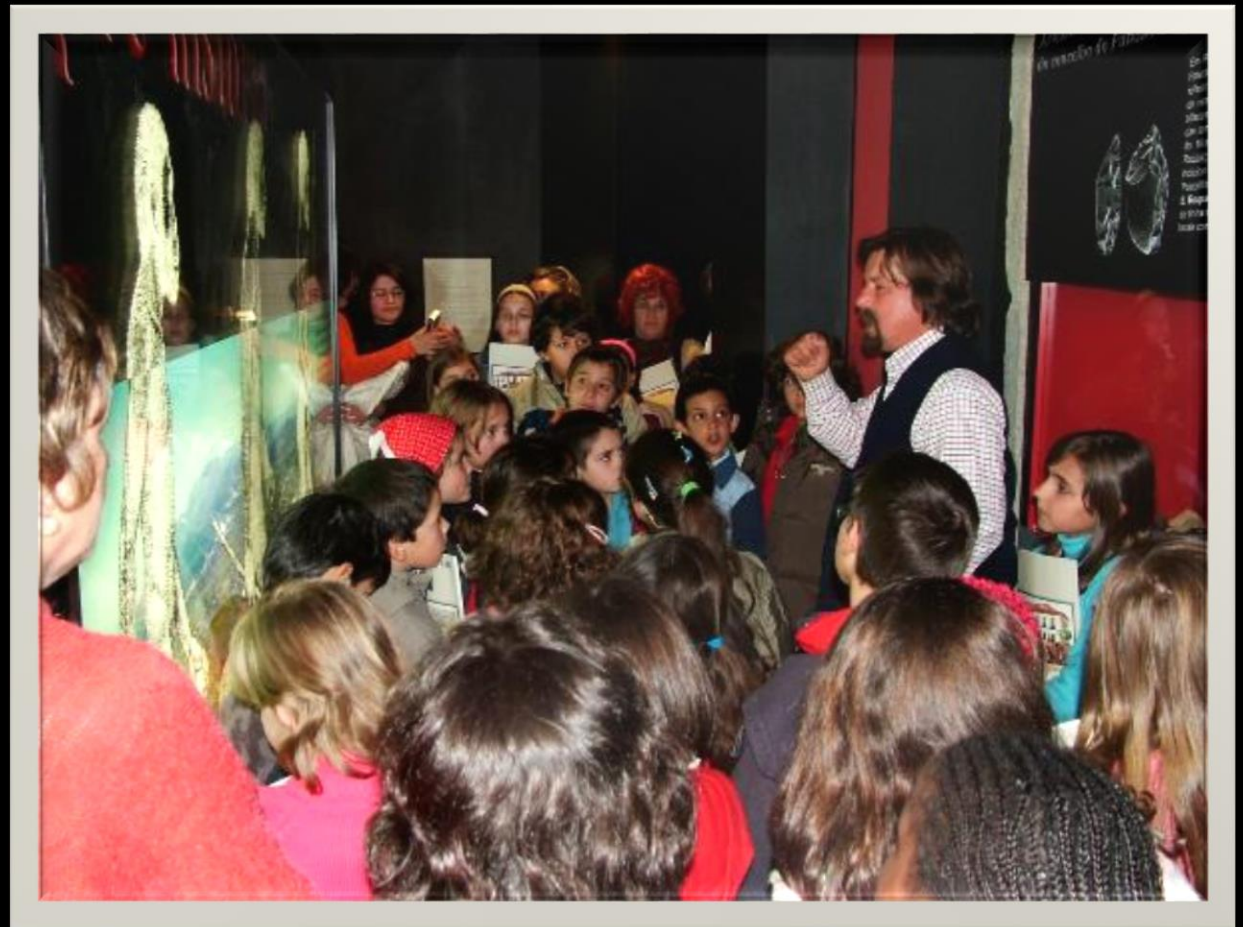
Museu do Fundão