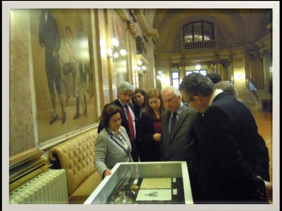
APOM e Museu da Assembleia da Republica- 2013