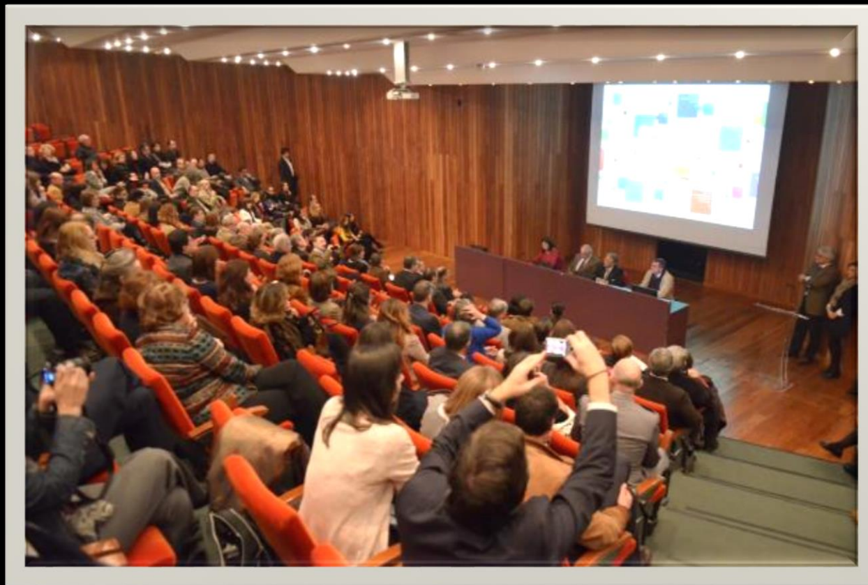
Museu da Farmácia, 2013