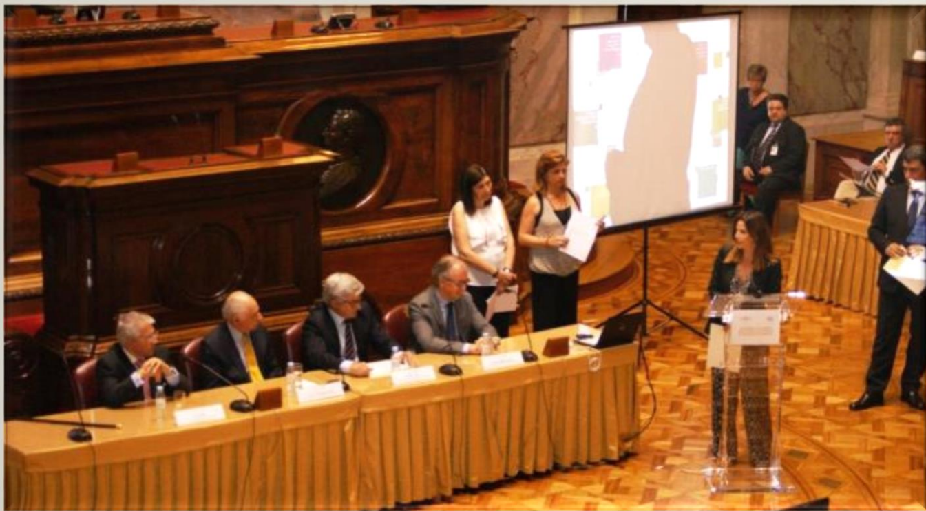
Prémios APOM 2015 - Assembleia da Republica -Sala do Senado