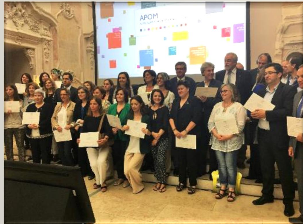
Prémios APOM 2016 – Museu do Dinheiro do Banco de Portugal