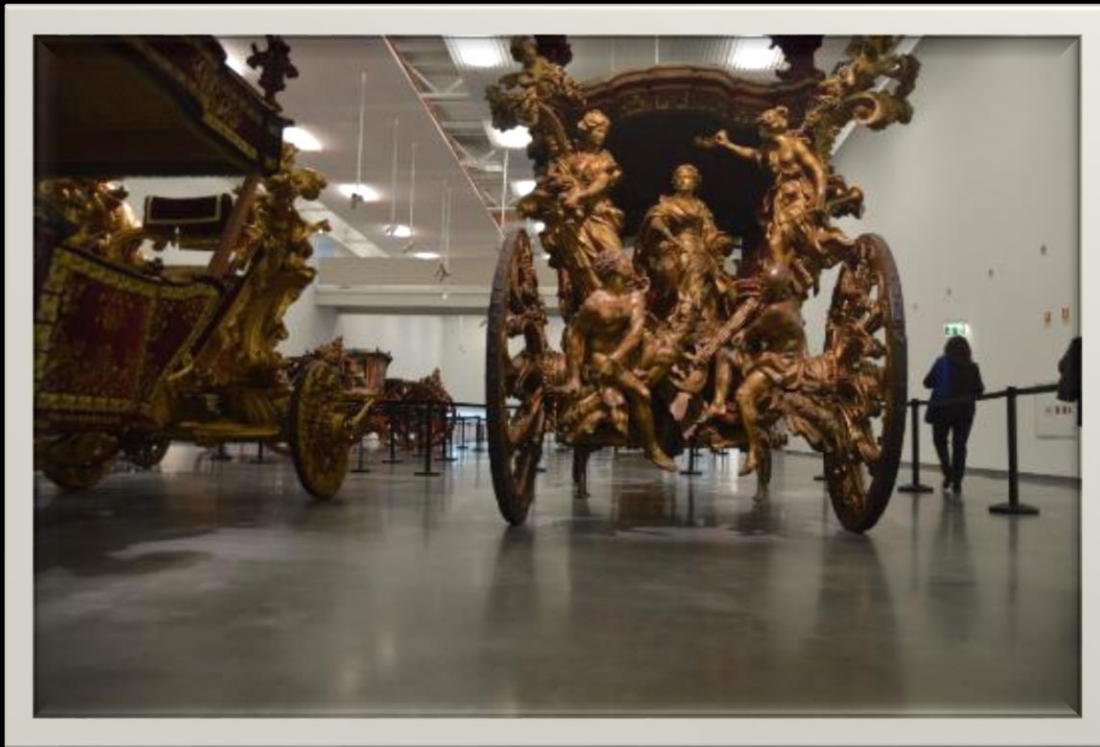
Museu Nacional dos Coches, 2016