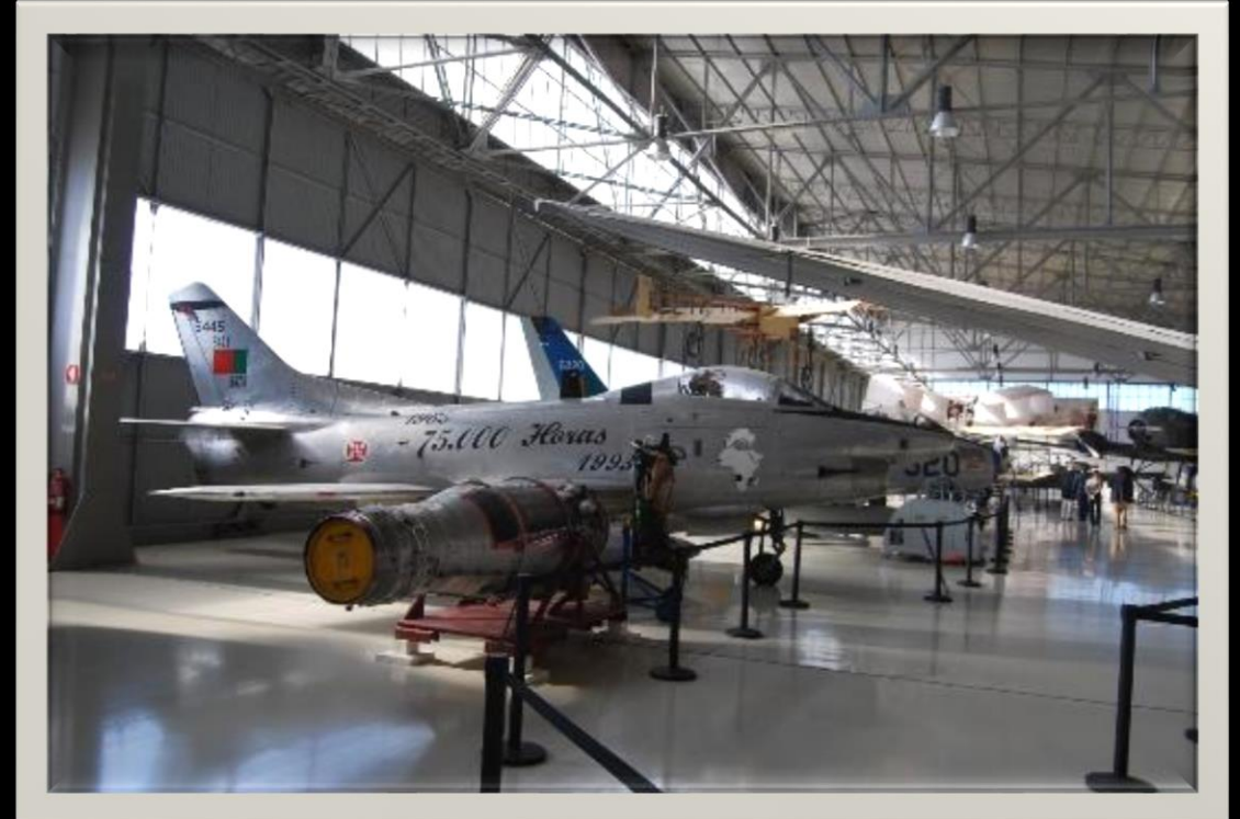
Museu do Ar, 2012