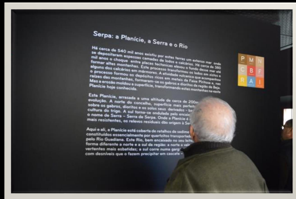
Museu Municipal de Arqueologia de Serpa-2016