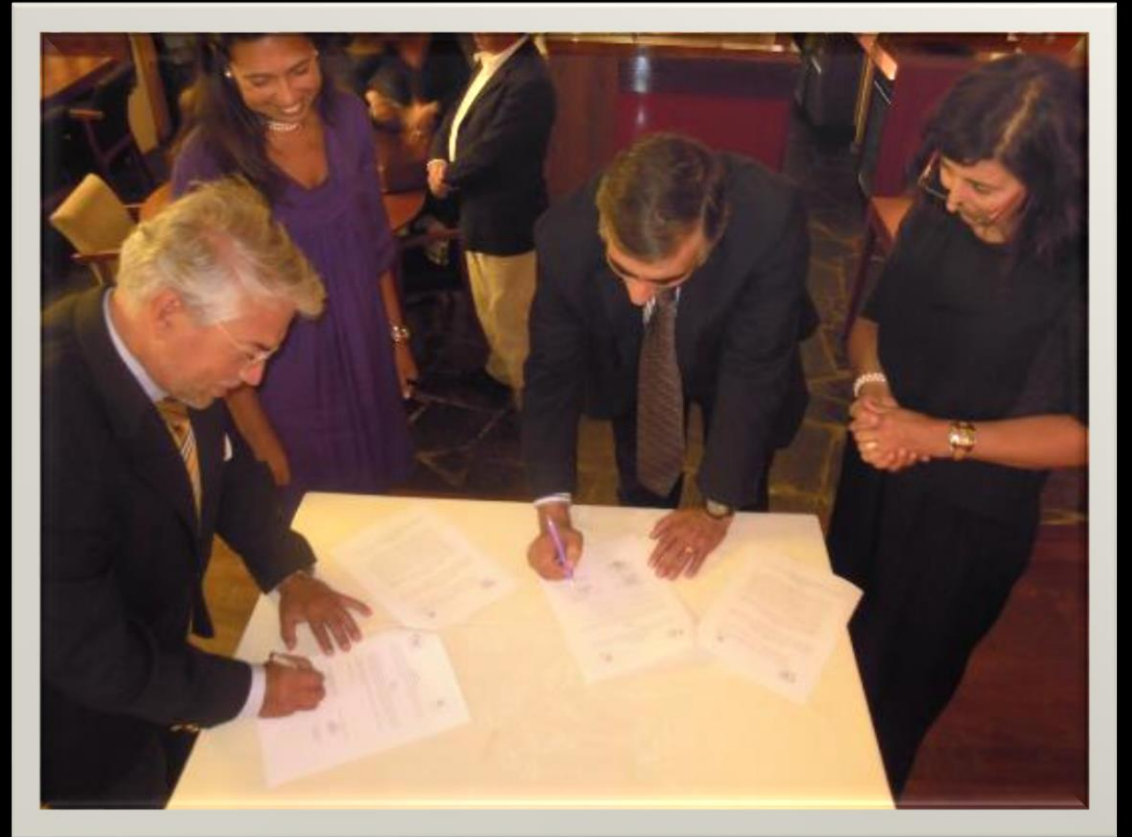
APOM e Escola Profissional Vale do Rio Barcarena, 2015